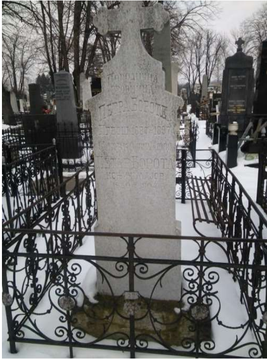
Илустрација 2. Породична гробница Борота-Јакшић-Павловић на Новом гробљу у Београду – лице и наличје