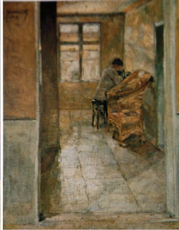
Љубомир Ивановић, Жена у ентеријеру, 1915.