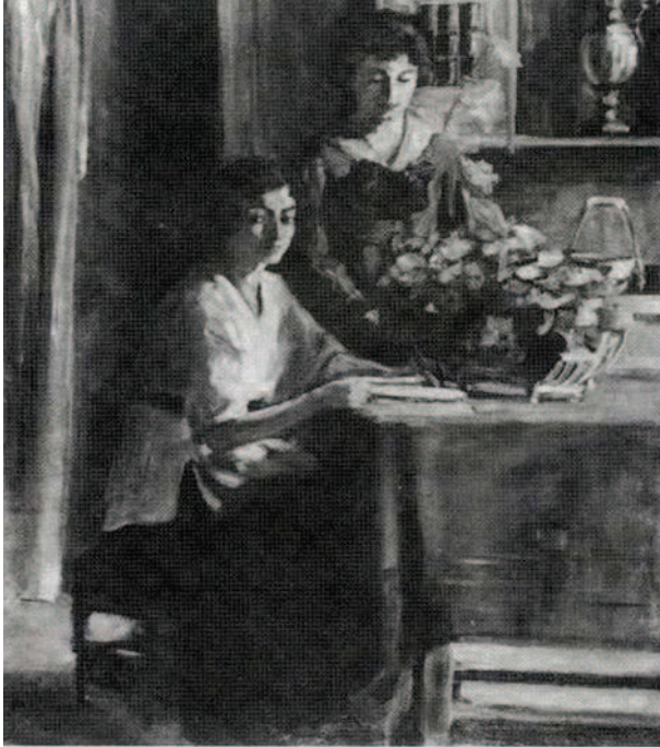
Анђелија Лазаревић, Ентеријер, 1919, уље на платну.