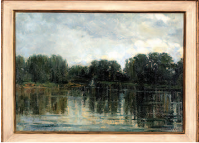
Анђелија Лазаревић, Река са обалом 38