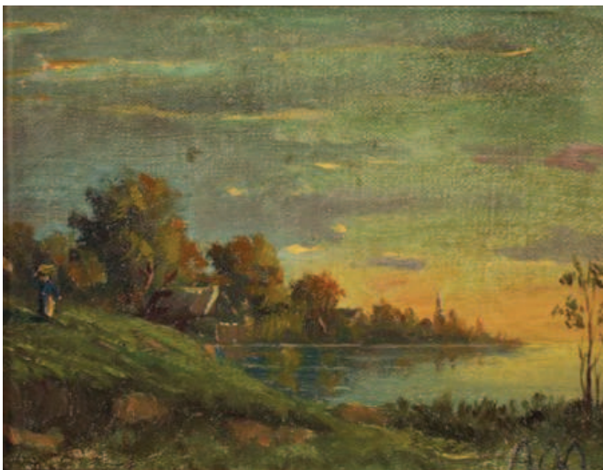
Анђелија Лазаревић, Предео поред језера, око 1905.