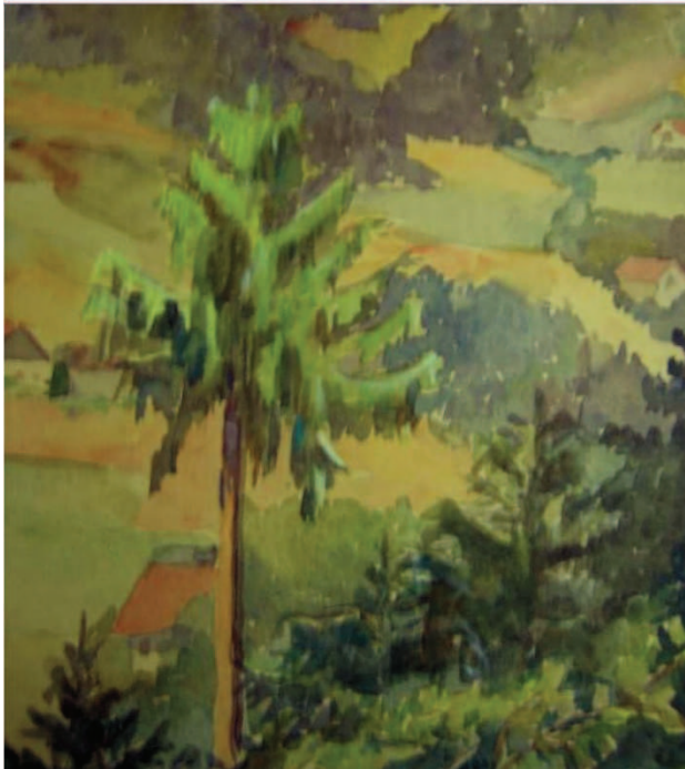
Анђелија Лазаревић, Предео, акварел.