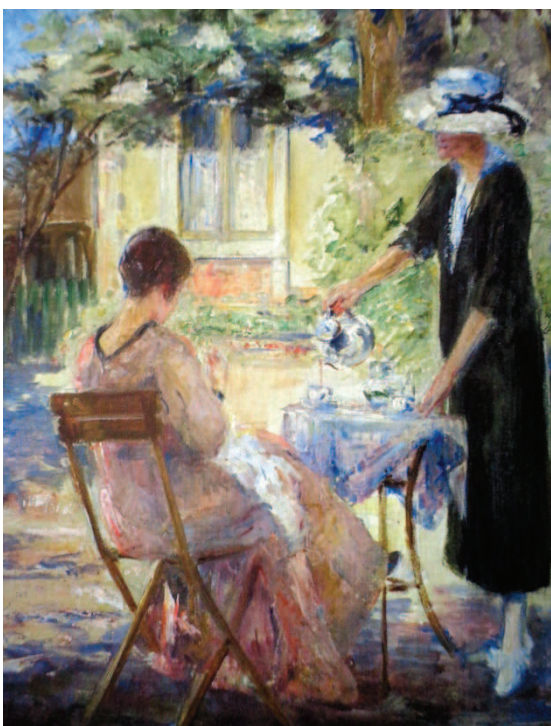
Бета Вукановић, Летњи дан, 1918.

Декоративност, украсни предмети, гардероба и накит остављени су женама, док мушкарци од украсних предмета носе само оно што представља успомену или има сврху, попут бурме или прибадача за оковратник. Визуелна представа мушких и женских простора и предмета може да функционише као слика друштвених стереотипа. Готово да