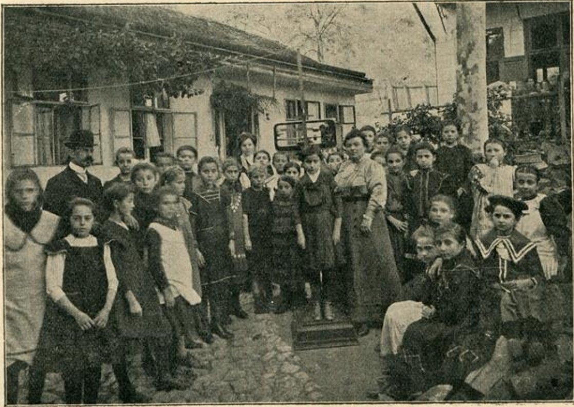
Мерење Зучевица (Is из 1911—12).