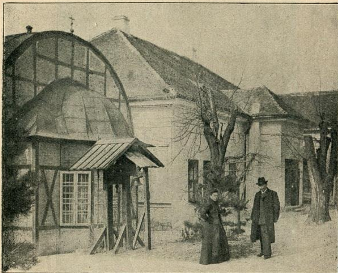
„Савет“ и црква са звонаром, из дворишта