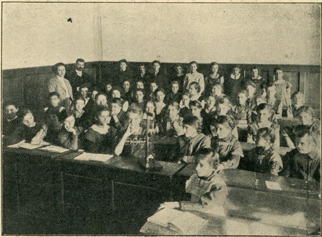
На часу физике (Шг из 1911—12). Учионица у првом павиљону.