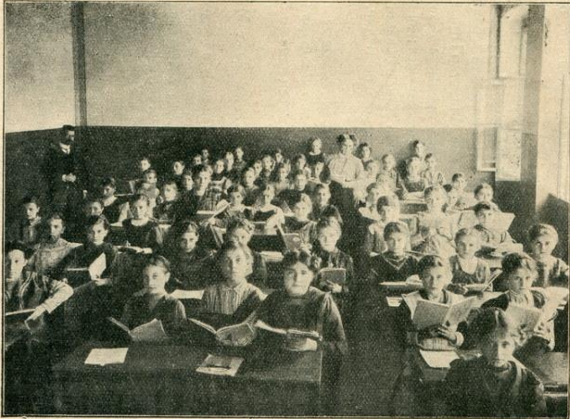
На часу српскога језика (Ш1 из 1911—12). Учионица у трећем павиљону (најбоља).