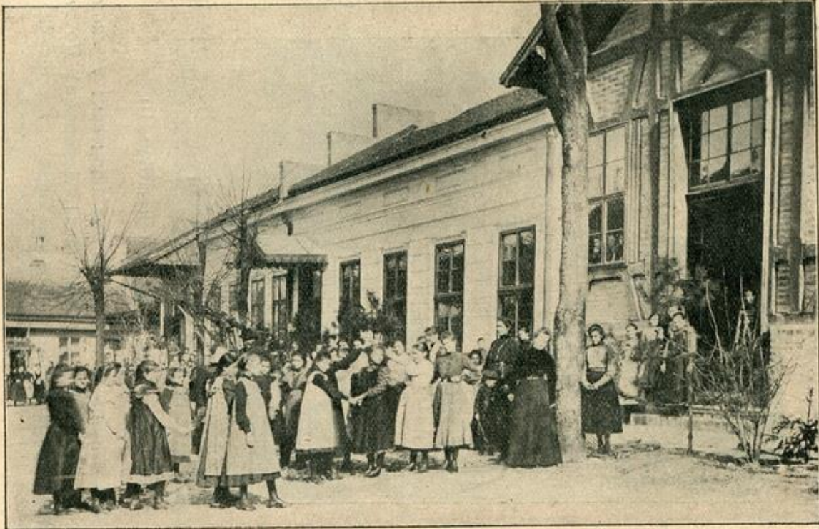
Ученице на одмору, испред павиљона (III р. из 1902—3).