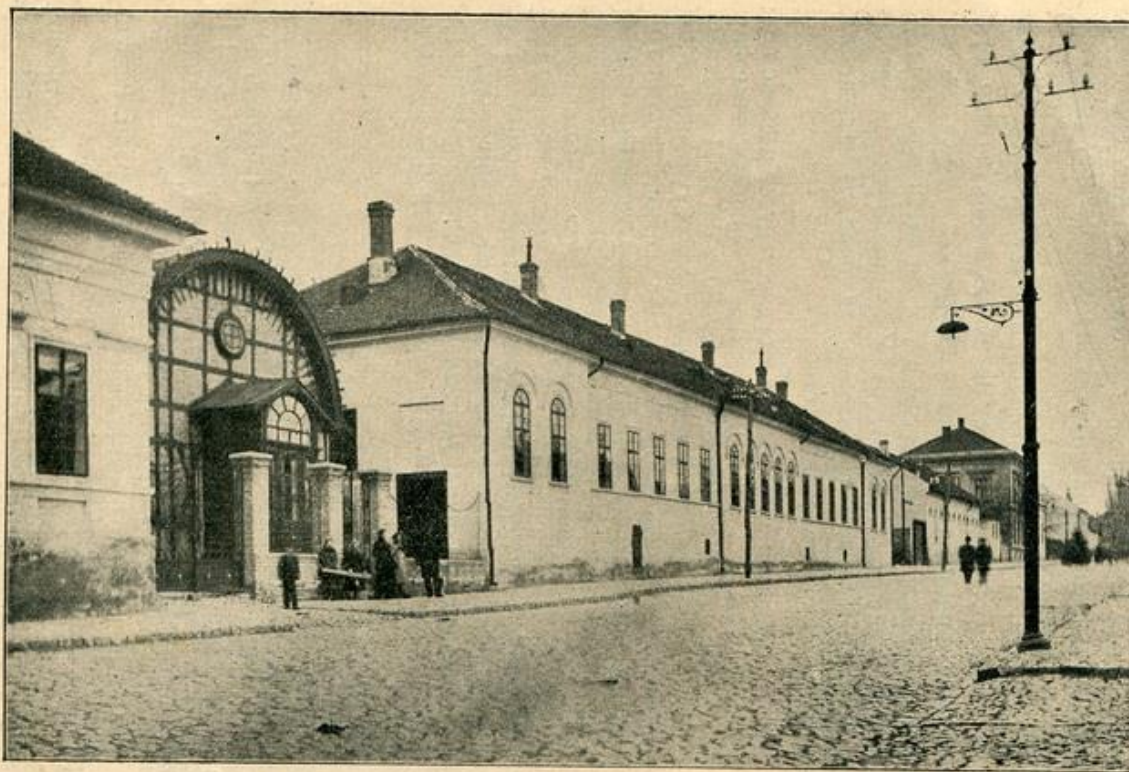
Фасада главне школске зграде и цркве, са једним углом „Савета“